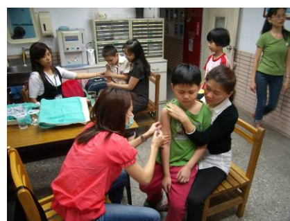
保健志工協助健康中心進行預防針施打工作