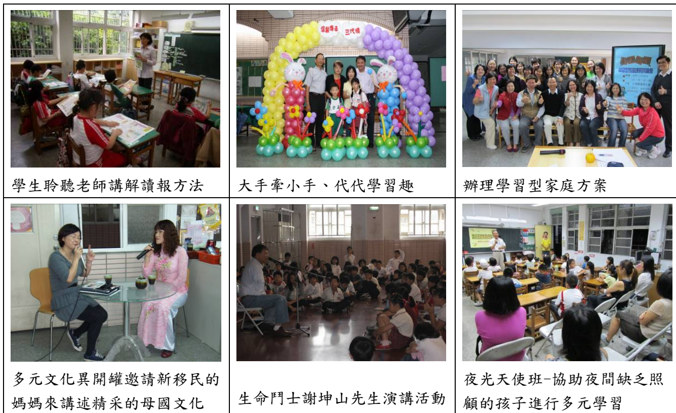
學生聆聽老師講解讀報方法