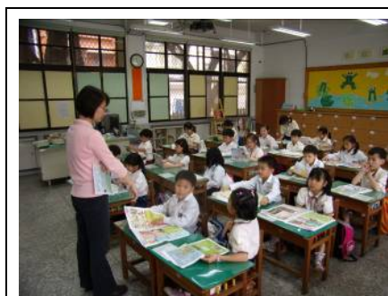
晨光志工帶領小朋友進行生命教育課程