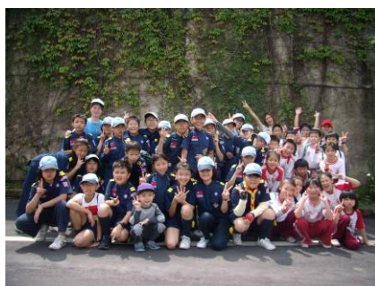
幼童軍志工利用假日帶領孩子們體驗童軍生活