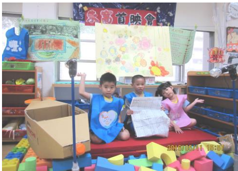
朱窩兒童劇其中一幕於星空組舞台由真人演出